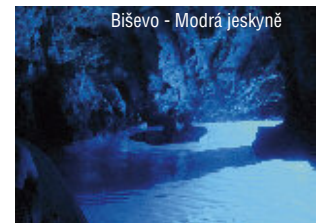
Biševo - Modrá jeskyňe