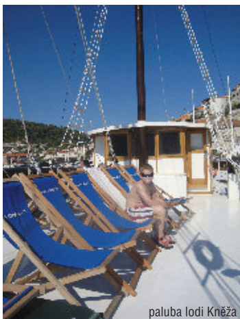
paluba lodi Kněža

Minimální počet osob pro uskutečnění plavby je 18, maximální kapacita lodi je 22 osob.