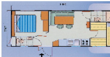
Nákres mobilhomů v kempu Diana & Josip

Fakultativně: malý pes - 6 €/den - platba na místě.