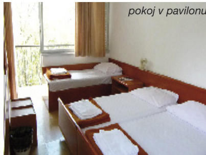
pokoj v pavilonu